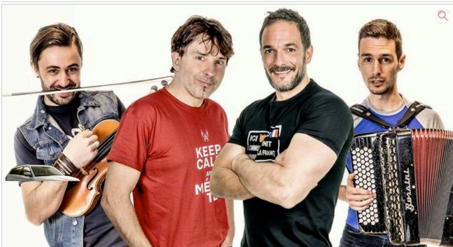
Le groupe auvergnat veut mettre le feu au Foirail pour cette soirée d'ouverture des fêtes de Tarbes

Dans le cadre de l'ouverture des fêtes de Tarbes, ce sera le groupe de folk auvergnat Wazoo qui se produira aujourd'hui, à partir de 22 heures, sur la place du Foirail.