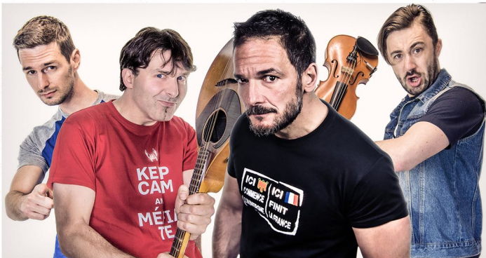
Wazoo va enflammer la place de Montcuq.