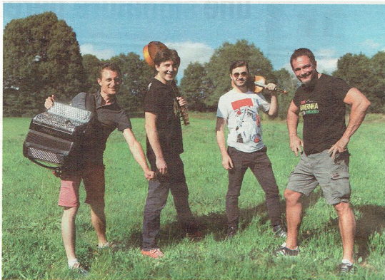
En plein air, comme ils aiment, les Wazoo sont venus à Saint-Étienne-de-Chomeil présenter leur nouvel album.